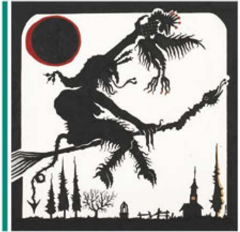
Joan Ponç s/t, s/d