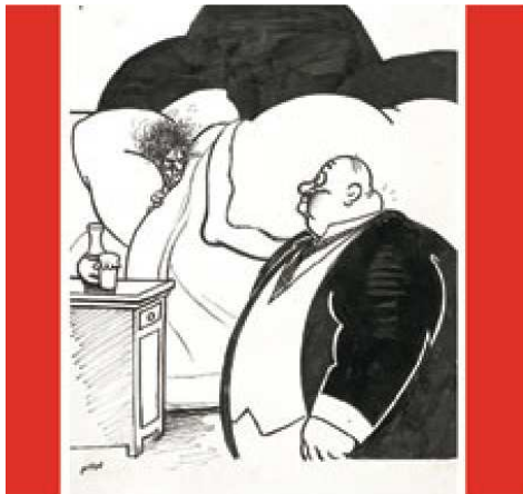
Mon s/t, s/d Dibuix a tinta sobre paper

Va compondre moltes sardanes, algunes dedicades a L'Hospitalet com Els Hospitalencs , La Marina hospitalenca , Carrer Xipreret , Plaça del Repartidor i altres a artistes amics com Solerjoveriana i Conxa la pintora .