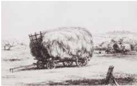
Pau Roig El carro de fenc Punta seca, c. 1910

El segle XIX va ser l'època, en el món de l'art, de la revolució permanent; aquell temps en què tot va evolucionar, en què tot estava en moviment i en què es buscaven nous camins. I el final de segle va ser un temps d'experimentació artística a la recerca de nous temes, de noves maneres d'entendre la creació artística, de nous reptes. La febre de la descoberta.