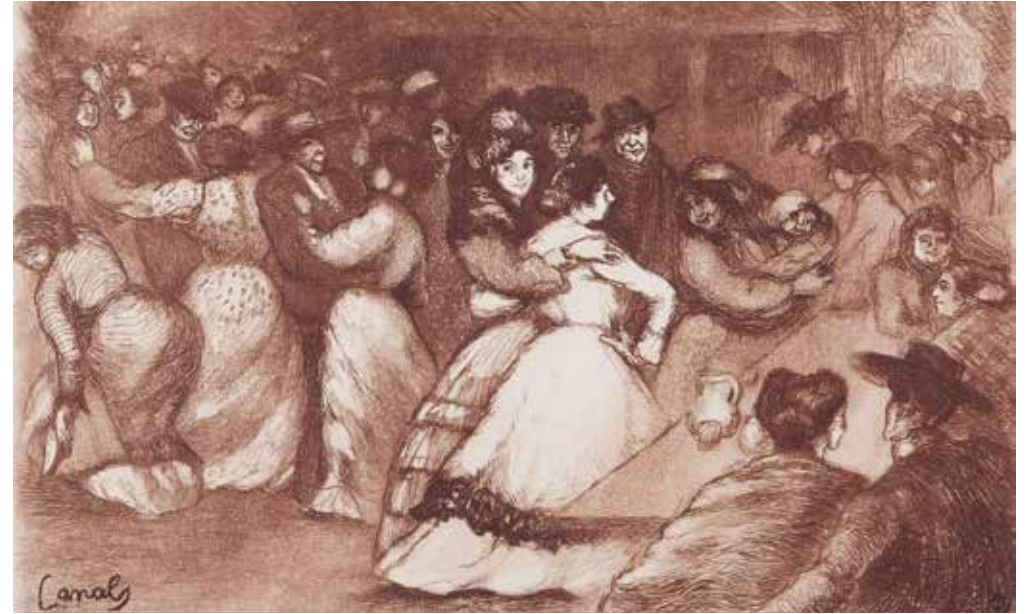
Ricard Canals, Festa popular Aiguafort i aiguatinta, c. 1900

El Museu de L'Hospitalet, de la mà de la Diputació de Barcelona, ens ofereix l'oportunitat de gaudir d'aquesta magnífica mostra de gravats, fidel reflex de la gran aportació dels artistes catalans al llenguatge plàstic de finals del segle XIX i principis del XX.