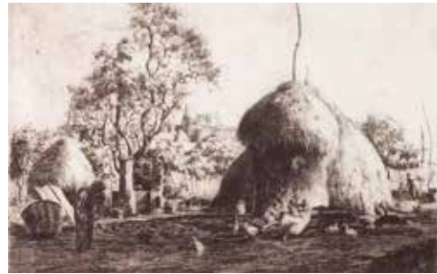
Joan Colom, La meule Aiguafort i aiguatinta, 1925