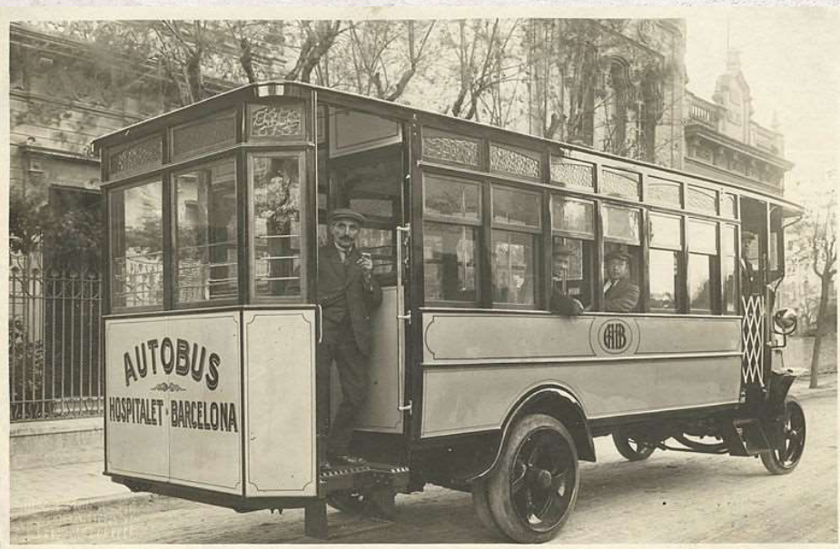
AMHLAF0025787 /d.Família Isern - Matilde Marcé