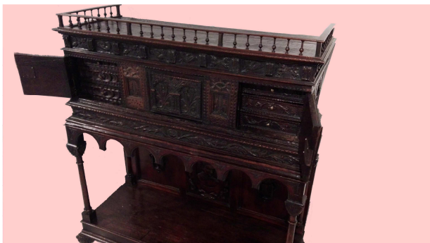
Detall calaixeres i portes a la part superior.