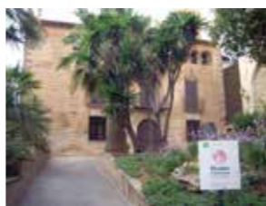
CASA ESPANYA Carrer de Joan Pallarès, 38