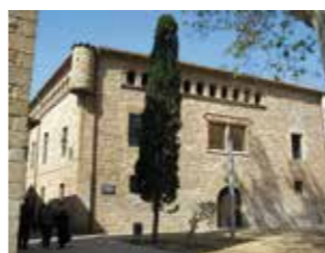
L'HARMONIA Plaça de Josep Bordonau i Balaguer, 6