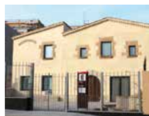
MASIA DE CAN RIERA Carrer de la Riera de l'Escorxador, 17

Telèfon: 93 338 13 96 • cultura.museu@l-h.cat • www.museu-l-h.cat • @MuseuLH