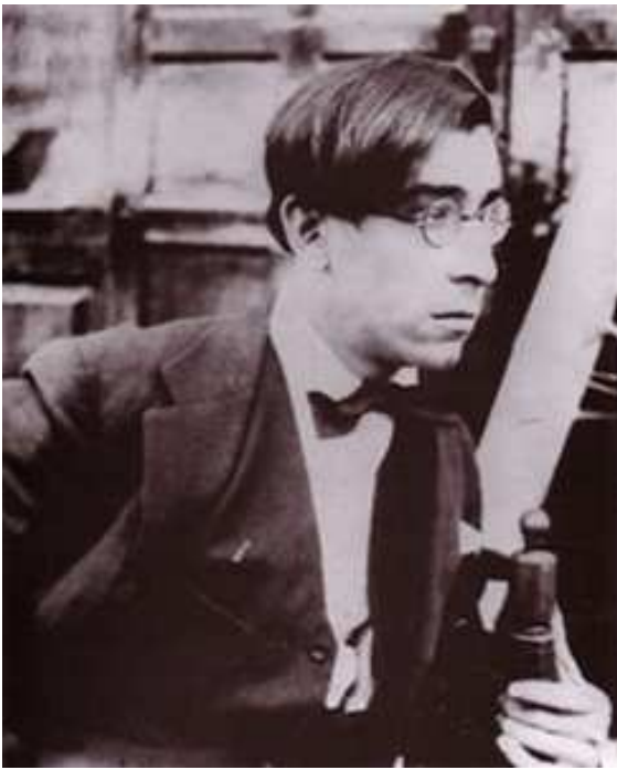
Rafael Barradas (s.d.)

Els últims anys de la vida de l'artista estan associats a la ciutat de l'Hospitalet. Entre 1926 i 1928 l'artista va viure al carrer de Josep Maria de Sagarra on el visitaven artistes i intel·lectuals de l'època, com Salvador Dalí, Luis Buñuel, Federico García Lorca o Margarida Xirgu . Les seves reunions eren conegudes com "el Ateneillo". Al novembre de 1928 va tornar a Uruguai i va morir als pocs mesos. La ciutat de l'Hospitalet ret homenatge a l'artista nomenant un carrer i l'auditori en la seva memòria.