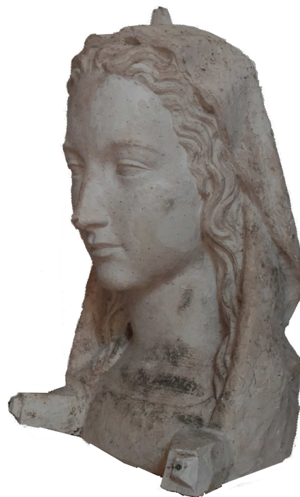
Autor: Rafael Solanic Balius Registre: H-1915