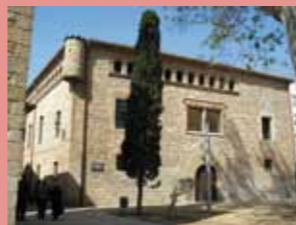
L'HARMONIA Plaça de Josep Bordonau i Balaguer, 6