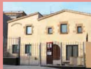
CAN RIERA Carrer de la Riera de l'Escorxador, 17

Telèfon: 93 338 13 96 • cultura.museu@l-h.cat • www.museu-l-h.cat • @MuseuLH