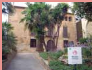
CASA ESPANYA Carrer de Joan Pallarès, 38