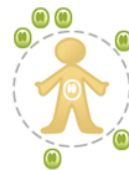
3- Cos immunitzat