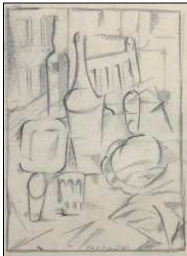
Rafael Barradas Natura morta cubista, sense data Llapis grafit sobre paper

"(...) el dia 20 d'abril de 1974 es va fer la presentació del quadre al Museu, essent l'encarregat de l'acte el crític Sebastià Gasch, amic íntim de Rafael Barradas i assidu a les tertúlies de l'"Ateneillo".