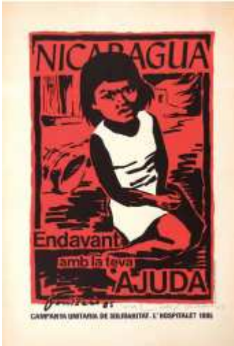
Carles Fontseré Nicaragua. Endavant amb la teva ajuda , 1985 Litografia sobre paper