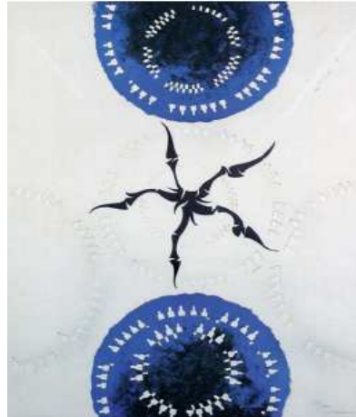
Moisés Villèlia Sense títol , 1974 Litografia sobre paper

Amb aquesta exposició d'obres sobre paper adquirides per l'ajuntament de L'Hospitalet concloem la presentació de la selecció d'obres que hem mostrat al llarg dels últims dos anys. Amb aquesta selecció hem volgut donar una idea de la varietat i importància de la col·lecció. Però al fons d'art del Museu de l'Hospitalet hi han moltes més obres, que han arribat gràcies a la generositat d'artistes, col·leccionistes, entitats i ciutadans i ciutadanes. A tots i totes volem agrair les seves donacions, esperant tenir altres ocasions per donar aquestes obres a conèixer.