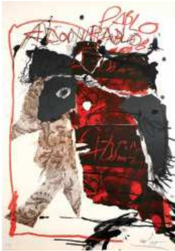
Antoni Clavé Sanmartí AISU (Sèrie Picasso) , 1985 Litografia, tinta xinesa i llapis de cera sobre paper