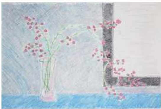
Maria Girona Benet Sense títol, 1988 Ceres sobre paper

Des de l'ajuntament de L'Hospitalet s'ha ampliat el fons d'art adquirint obres dels artistes catalans més importants i coneguts, amb el criteri de vincular la col·lecció amb la producció artística contemporània i d'anar incorporant obres i artistes que permetin completar un recorregut històric pels diferents estils i tendències artístiques d'aquest segle.