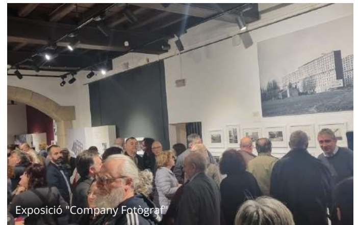
Exposició "Company Fotògraf"