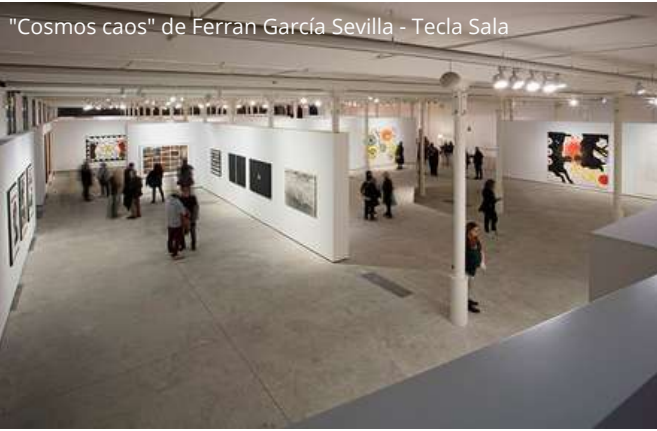
"Cosmos caos" de Ferran García Sevilla - Tecla Sala