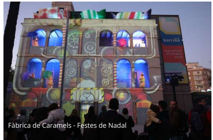
Fàbrica de Caramels - Festes de Nadal