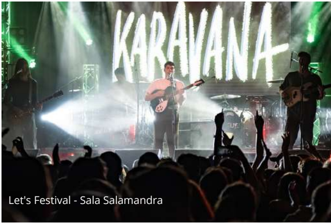
Let's Festival - Sala Salamandra