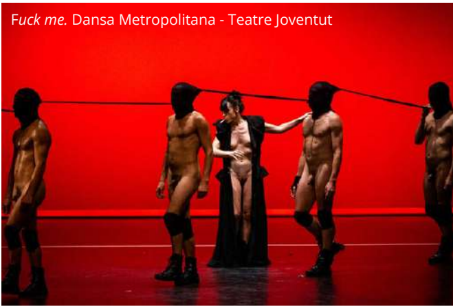
Fuck me. Dansa Metropolitana - Teatre Joventut