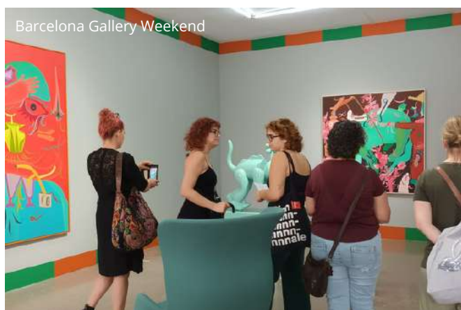
Barcelona Gallery Weekend