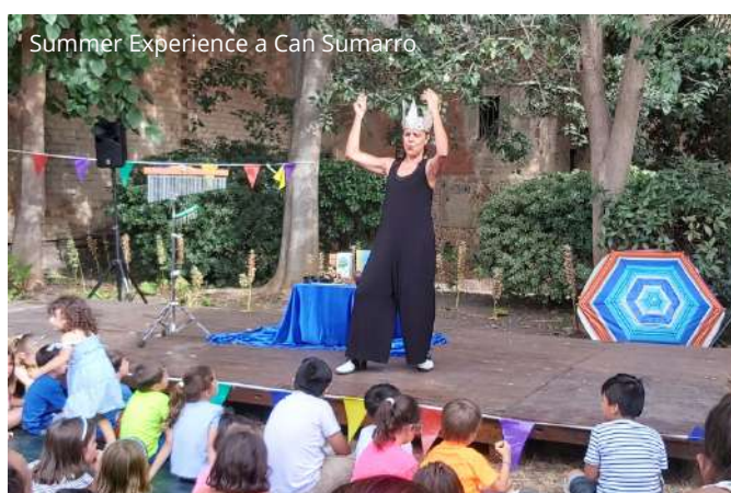
Summer Experience a Can Sumarro