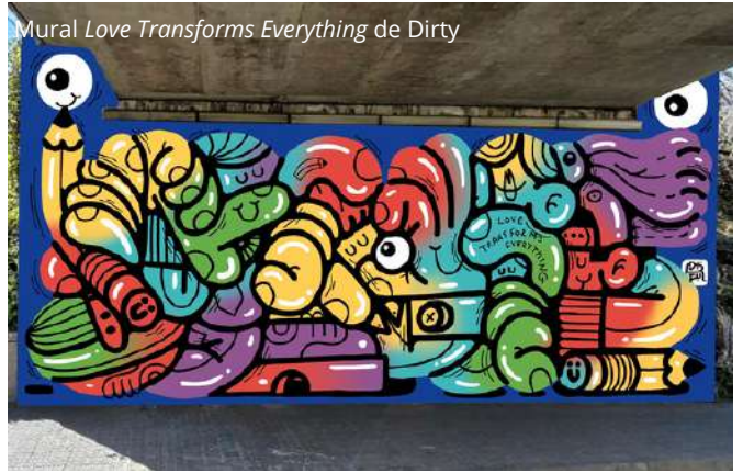
Mural Love Transforms Everything de Dirty