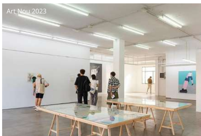
Art Nou 2023