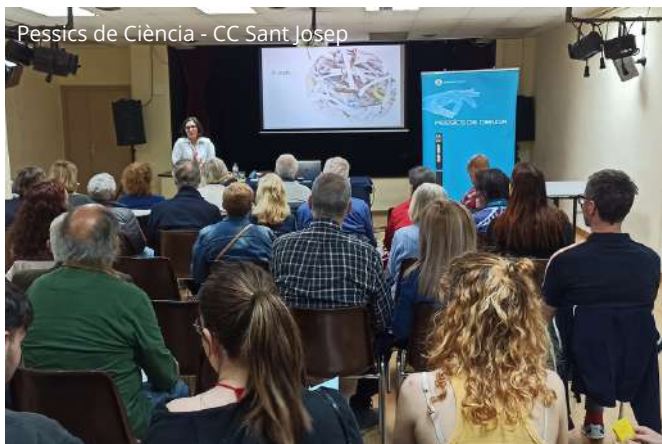
Pessics de Ciència - CC Sant Josep