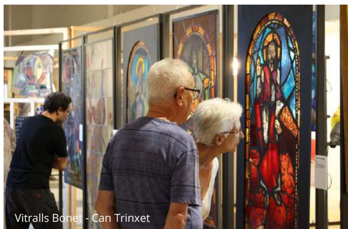
Vitralls Bonet - Can Trinxet