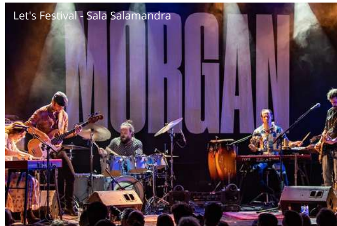
Let's Festival - Sala Salamandra