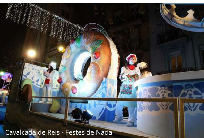
Cavalcada de Reis - Festes de Nadal