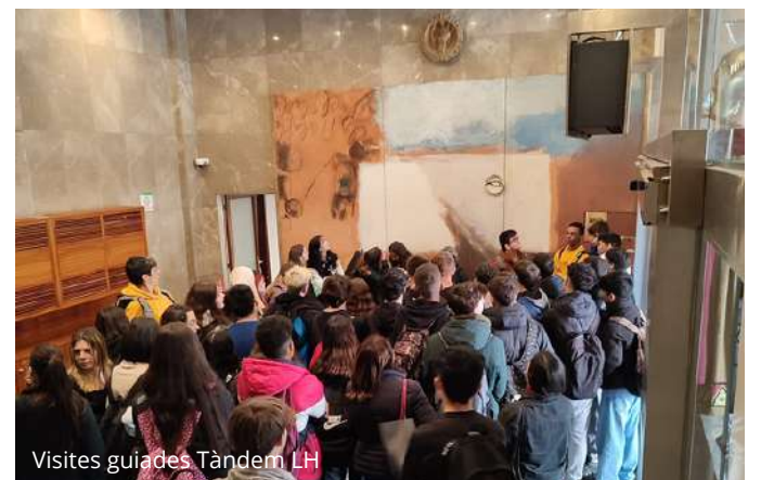
Visites guiades Tàndem LH