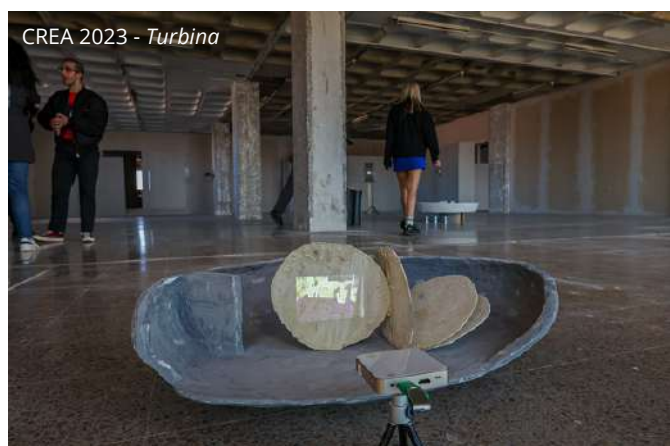
CREA 2023 - Turbina