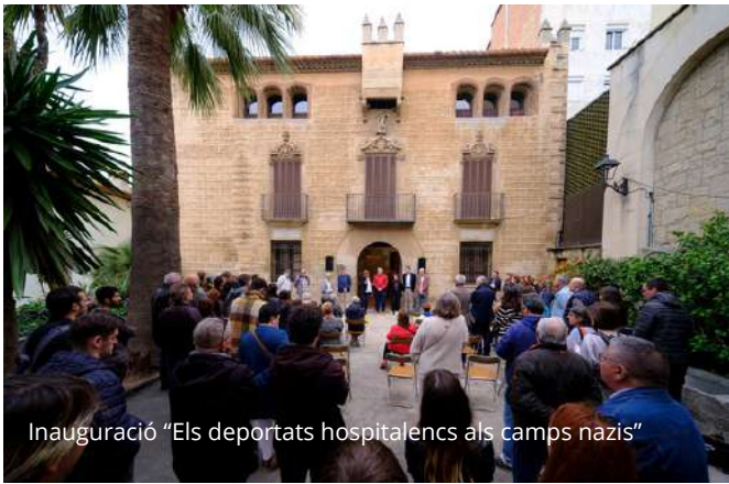
Inauguració "Els deportats hospitalencs als camps nazis"