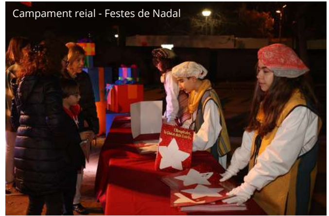
Campament reial - Festes de Nadal