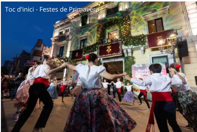
Toc d'inici - Festes de Primavera