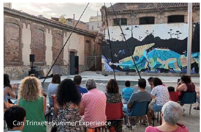
Can Trinxet - Summer Experience