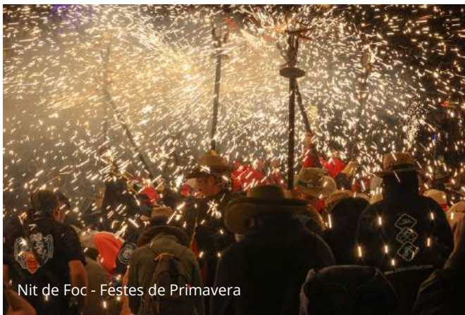
Nit de Foc - Festes de Primavera