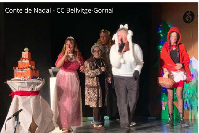
Conte de Nadal - CC Bellvitge-Gornal