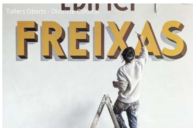
Tallers Oberts - Districte Cultural