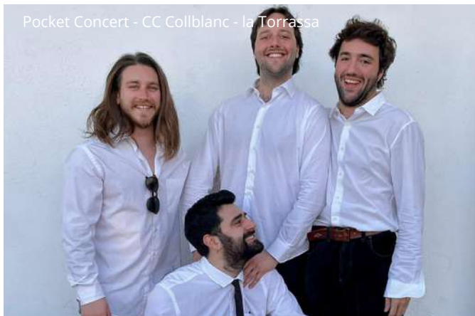
Pocket Concert - CC Collblanc - la Torrassa