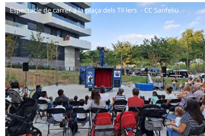
Espectacle de carrer a la plaça dels Til·lers - CC Sanfeliu