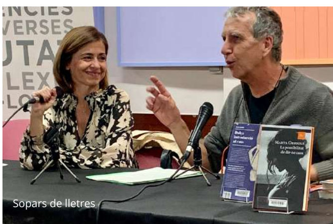
Sopars de lletres