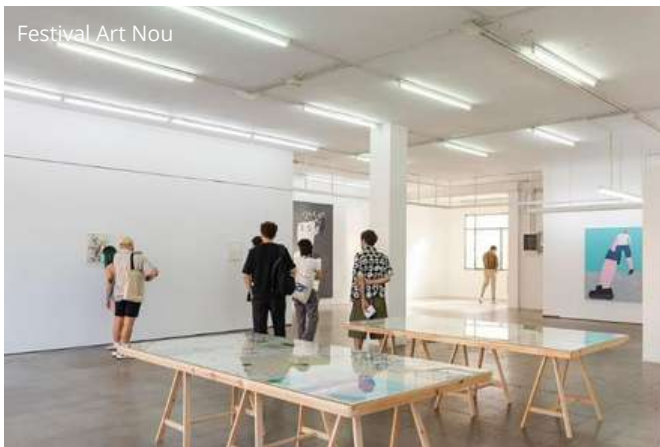
Festival Art Nou