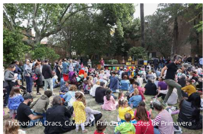
Trobada de Dracs, Cavallers i Princeses - Festes de Primavera