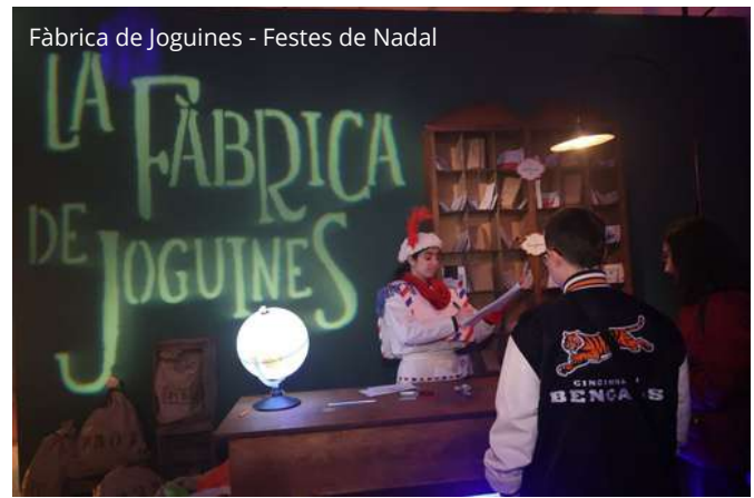
Fàbrica de Joguines - Festes de Nadal