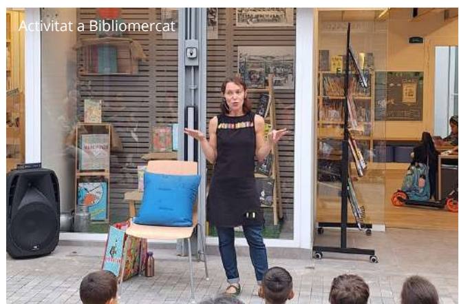
Activitat a Biblimercat