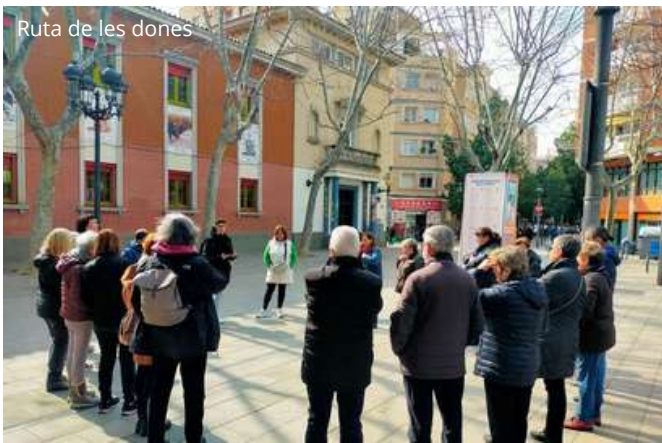
Ruta de les dones