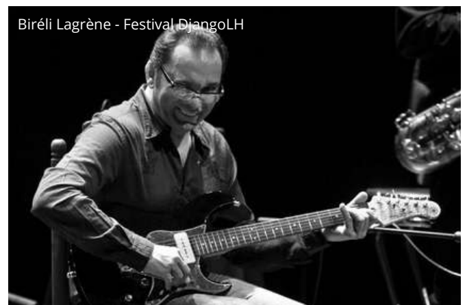
Biréli Lagrène - Festival DjangoLH