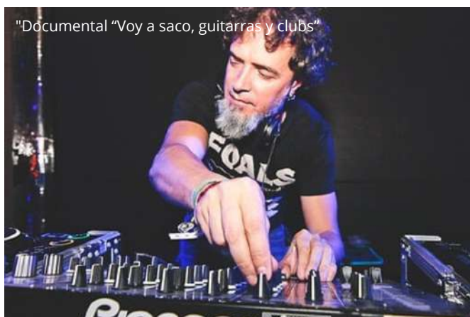
"Documental "Voy a saco, guitarras y clubs"