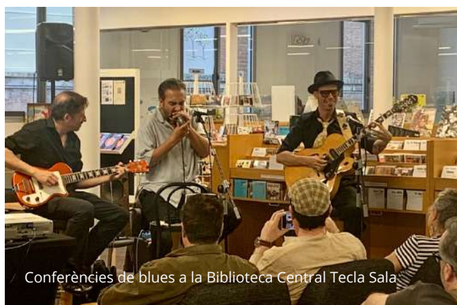
Conferències de blues a la Biblioteca Central Tecla Sala