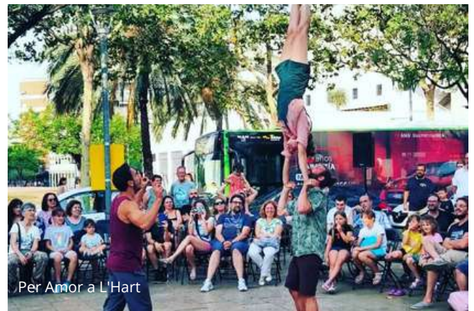
Per Amor a L'Hart