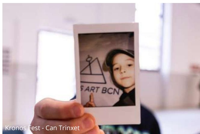
Kronos Fest - Can Trinxet