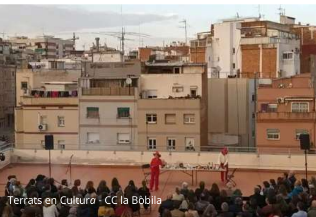
Terrats en Cultura - CC la Bòbila