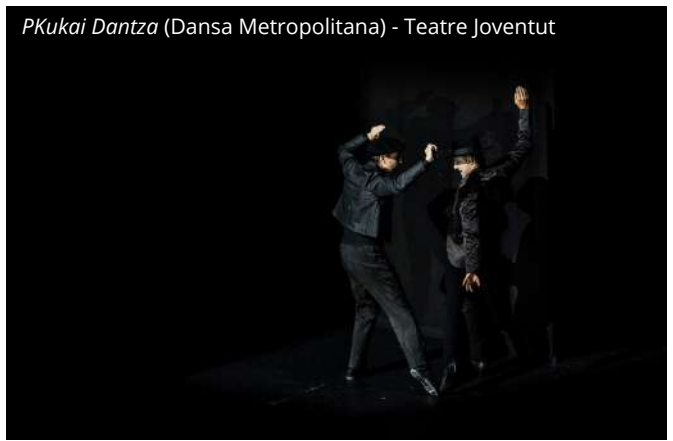
PKukai Dantza (Dansa Metropolitana) - Teatre Joventut