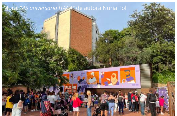
Mural "45 aniversario ITACA" de autora Nuria Toll