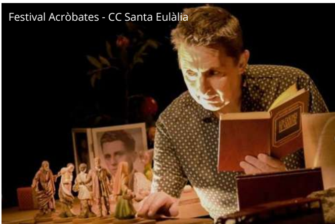
Festival Acròbates - CC Santa Eulàlia