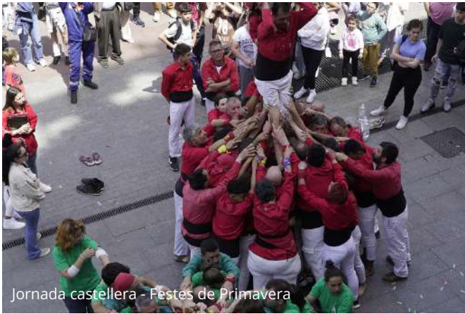
Jornada castellera - Festes de Primavera