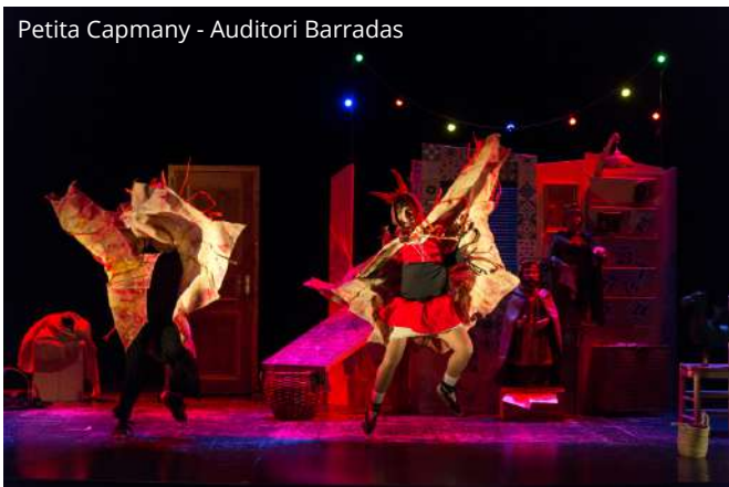
Petita Capmany - Auditori Barradas