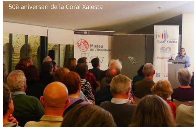
50è aniversari de la Coral Xalesta