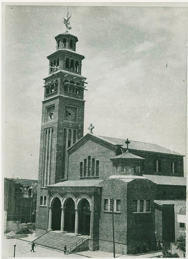
AMHL 902-144 AF 0004176 /a.Autor desconegut/da /d.àlbums Monrós UEC

Jaume Huguet I, treballava amb el seu fill, Jaume Huguet II, del qual també en podem apreciar la participació a Mort de sant Roc a la presó. Els Huguet formen part d'una nova generació de pintors autòctons que emergeix el darrer terç del segle XVI que, adaptats als models artístics italians coetanis, treballaven en una organització de "taller familiar".