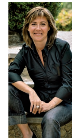
Núria Marín i Martínez Alcaldessa de L'Hospitalet

Fins ara hem recorregut un camí profitós gràcies a la col·laboració de tots els col·lectius que s'han implicat en el Projecte educatiu de ciutat. Hem de continuar endavant, treballant plegats amb la mateixa empena i amb la mateixa il·lusió per a l'educació dels nens i de les nenes i per un futur en el qual L'Hospitalet sigui econòmicament més competitiu i estigui ben posicionat en l'entorn metropolità i en el conjunt de Catalunya.