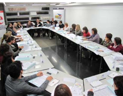
Trobada d'un dels grups de treball

Després de la diagnosi educativa es van definir les cinc línies d'acció estratègiques que s'han explicat en els apartats anteriors i l' estructura organitzativa del PEC .