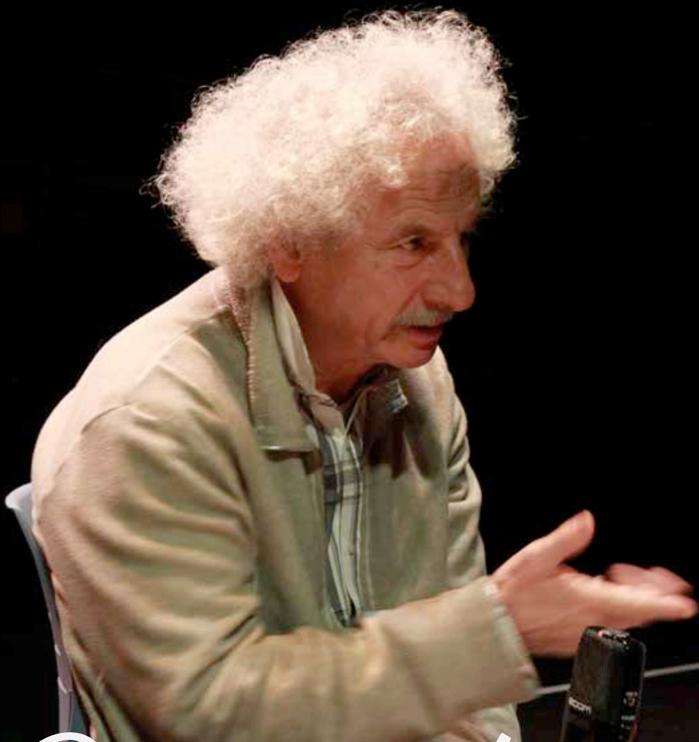
RAFAEL ÁLVAREZ, EL BRUJO, Actor y Dramaturgo

YO CON BARCELONA TENGO MUCHA HISTORIA. HE VIVIDO AQUI, HE TENIDO COMPANERAS SENTIMENTALES CATALANAS Y HE SOBREVIVIDO