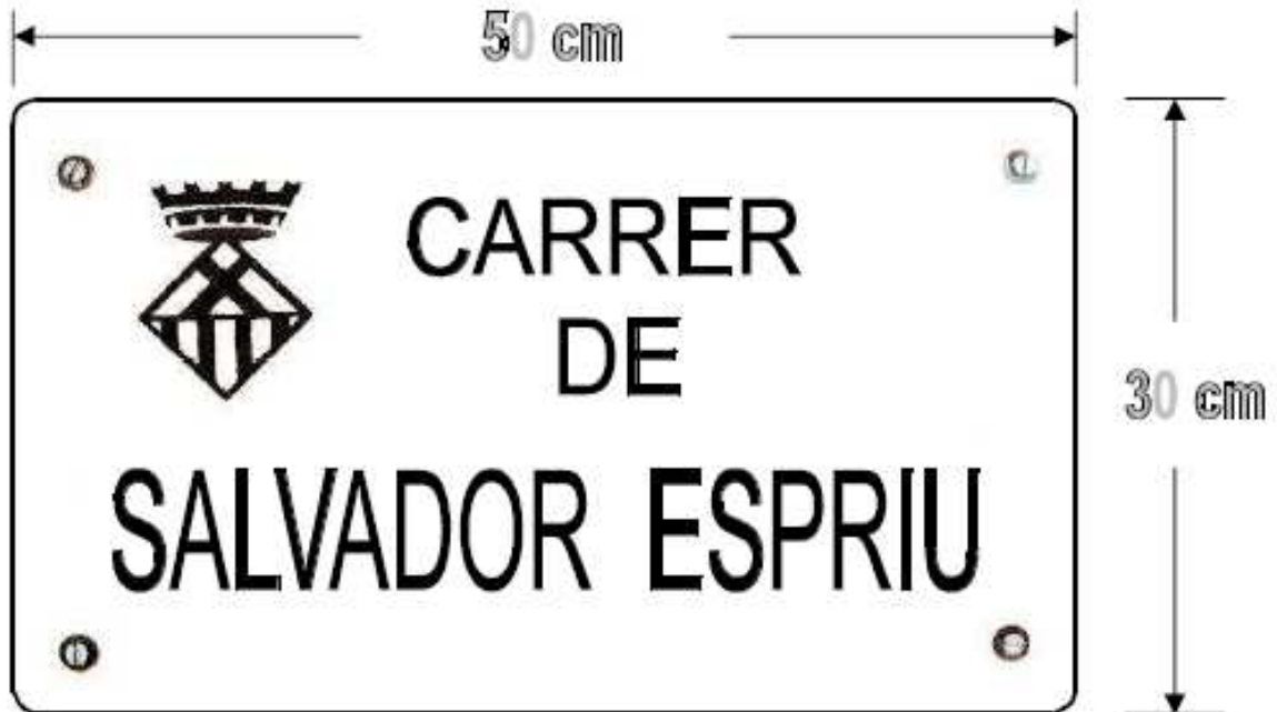
DETALL 1 - Placa de retolament (marbre blanc – gruix de 2 cm)