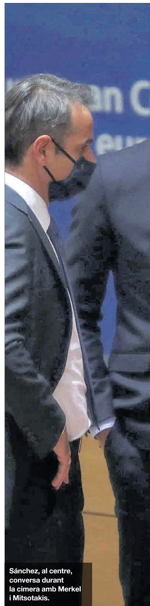
Sánchez, al centre, conversa durant la cimera amb Merkel i Mitsotakis.

El Govern pretén destinar aquesta gegantina allau de recursos a la digitalització, la transició ecològica, a reduir el despoblament de l'Espanya